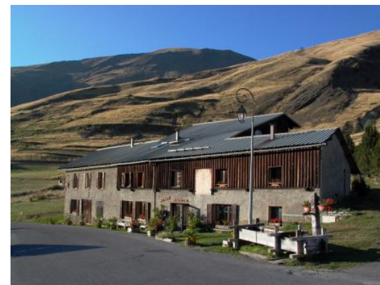
La façade du Chalet