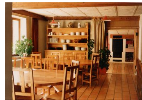
La salle à manger

L'hébergement se fait en chambres de 2 à 6 lits au premier étage. Sanitaires et douches à l'étage. L'étage est consacré au repos. La cuisine n'y est pas autorisée.