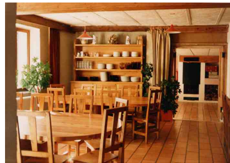
La salle à manger

Le rez-de-chaussée est consacré à la collectivité : salle à manger et cuisine, salle de détente, salle d'activités (ping-pong ou réunion). Les repas se prennent autour de grandes tables en bois. Salle des chaussures et du matériel à l'entrée du chalet. Sanitaires et douches.