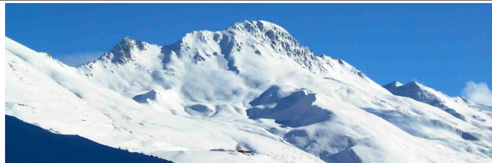
Fontgillarde dans la vallée de l'Aigue Agnelle sous le Grand Queyras

Le territoire permet de pratiquer le ski de randonnée alpine, le ski alpin, le surf des neiges, le ski de fond, la randonnée nordique, le télémark ou les raquettes à neige.