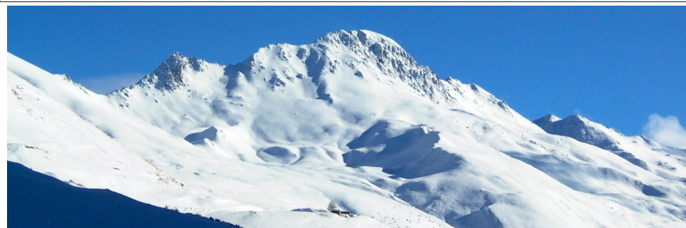
Fontgillarde dans la vallée de l'Aigue Agnelle sous le Grand Queyras

Le territoire permet de pratiquer le ski de randonnée alpine, le ski alpin, le surf des neiges, le ski de fond, la randonnée nordique, le télémark ou les raquettes à neige.