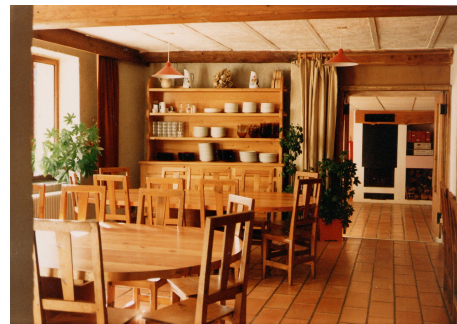
La salle à manger

Le rez-de-chaussée est consacré à la collectivité : salle à manger et cuisine, salle de détente, salle d'activités (ping-pong ou réunion). Les repas se prennent autour de grandes tables en bois. Salle des chaussures et du matériel à l'entrée du chalet. Sanitaires et douches.